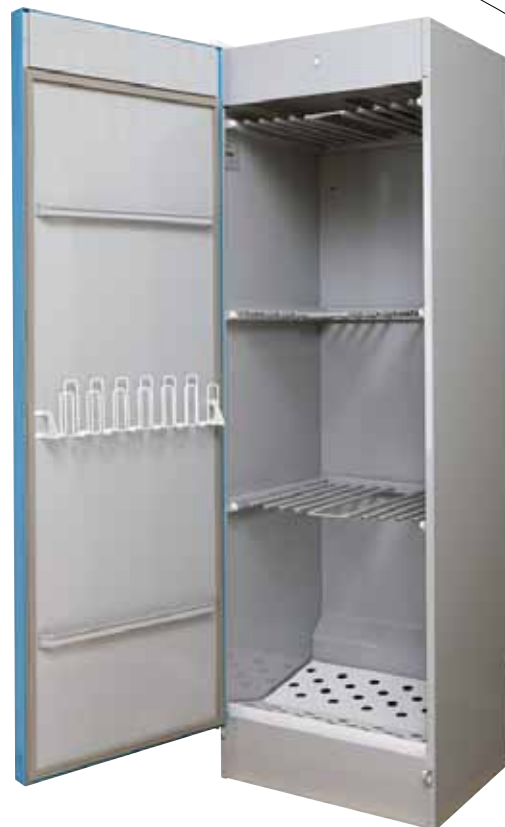
Tørreskabet på billedet er vist med tilbehøret skostativ og vantebøjle til at lette tørringen.

** Tilsluttes ved hjælp af medfølgende trækafbryder med slange